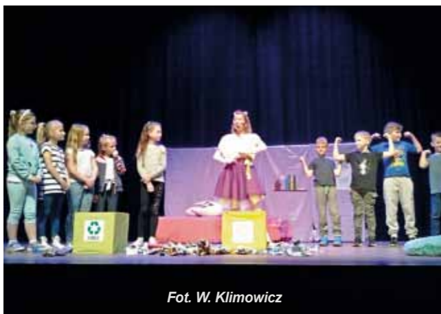
Fot. W. Klimowicz