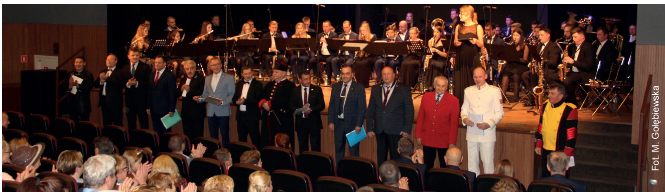
Fot. M. Gołębiowska