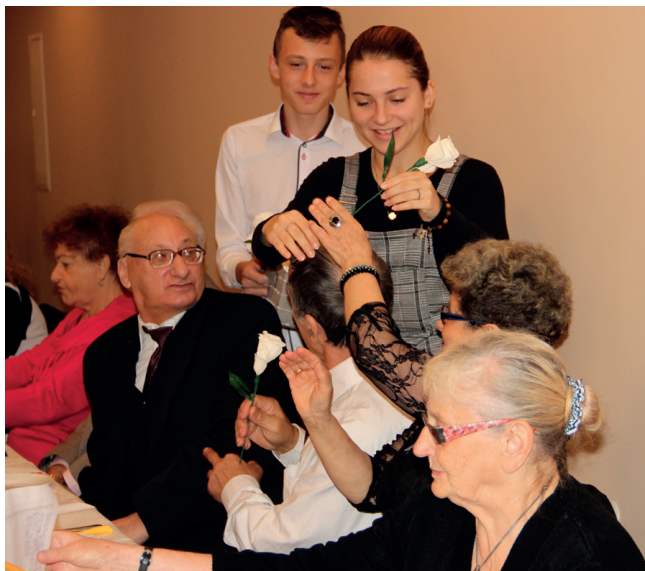
Fot. M. Gołębiowska