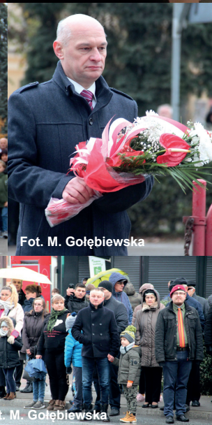
Fot. M. Gołębowska