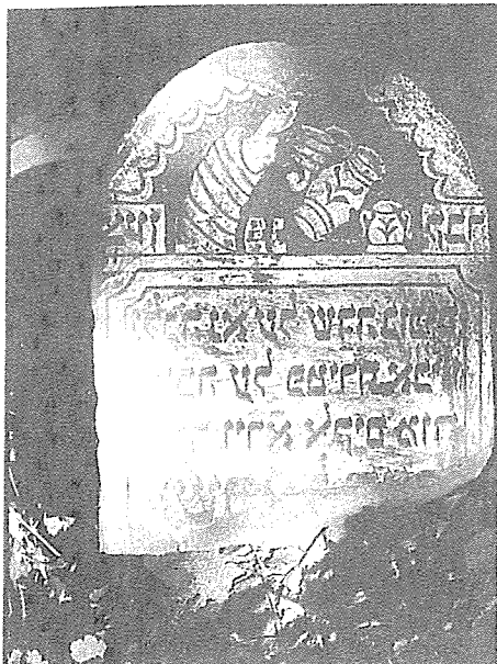
Nagrobek (macewa) z cmentarza żydowskiego w Zambrowie

Pierwszym cmentarzem Żydów z Zambrowa był kirkut w Jabłonce. Obecnie zachowany cmentarz powstał w latach 30-tych XIX wieku. Zlokalizowany jest przy ulicy Łomżyńskiej na dużym wyniesieniu (1,224 ha), częściowo ogrodzony jest drucianym płotem. Jego stan jednak woła o pomstę do nieba. Należy ubolewać, iż z roku na rok giną kolejne macewy (nagrobki żydowskie) i nikt z lokalnych władz nie może temu zapobiec. A szkoda tym większa, iż te które się zachowały wskazują na niezwykle wysoki poziom sztuki kamieniarskiej. Na podstawie zachowanych kilku wspaniałych macew wykonanych z piaskowca możemy odczytać daty i nazwiska osób