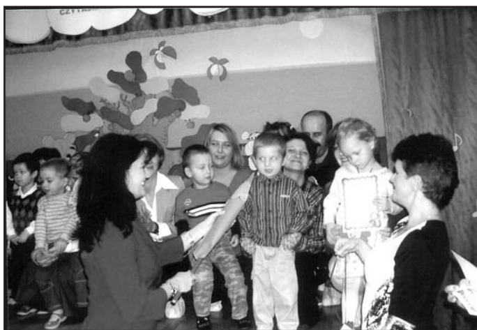
fol. MP 6

uznana za bardzo ciekawą i atrakcyjną nie tylko dla rodziców, ale i dla dzieci. Nadania temu dniu rangi oraz to-