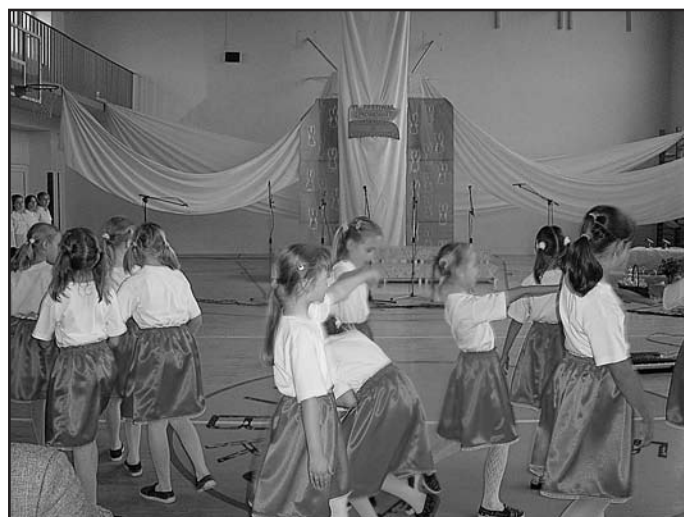
Zespół wokalny ze szkoły podstawowej w Zakrzewie Starym, fot. Iza Rudziewicz