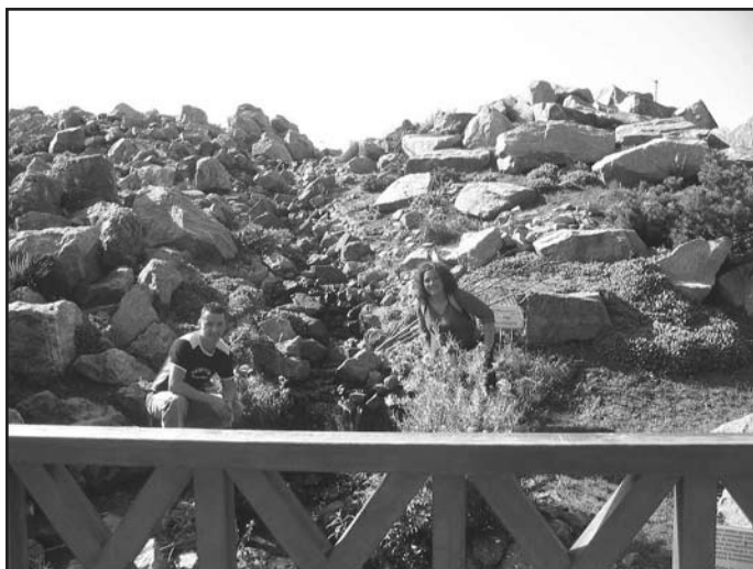
Uczniowie ZSA