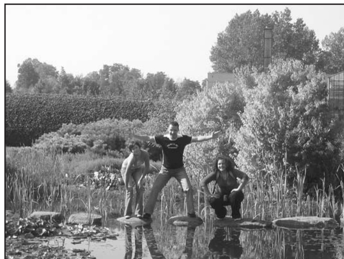
Uczniowie ZSA

pięknie kwitnie franklinia amerykańska, krzew z rodziny herbatowatych. Podziwialiśmy owocujące drzewa magnolii. W ogrodzie bylinowym uczestników zaciekały kwitnące jeszcze nawłocie i dzielniany oraz jesienne złocienie, georginie, pacioreczniki. Dużą atrakcją był spacer między skałkami w Kolekcji Roślin Górskich. Mogliśmy tam zobaczyć szarotkę alpejską, czosnek skalny, zimowity jesienne (roślinność tatrzańska), zaś w grupie roślin charakterystycznych dla Pienin złocienia zawadzkiego oraz chabra barwnego w odmianie pienińskiej. Efekt był imponujący! Myślę, że zrobił wrażenie zarówno na miłośnikach przyrody, jak i na wielbicielach gór. Szemrzące górskie potoki, skaliste szczyty, strome kręte szlaki, setki gatunków roślin, drewniane mostki czy góralskie zabudowania wprowadziły w urlopowy nastrój zarówno młodzież, jak i rolniczki.