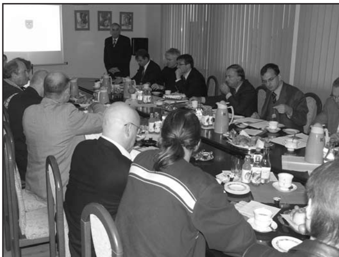
Burmistrz Miasta wita członków Komitetu oraz dziękuje za przyjęcie zaproszenia,

Wszyscy obecni na spotkaniu otrzymali materiały informacyjne w wersji polsko-angielskiej, by mogli bliżej zapoznać się z całą sytuacją. Na zakończenie zaprezentowano krótki film ukazujący nasilenie ruchu na ważnych zambrowskich skrzyżowaniach, szczególnie ruch na 5 - metrowej ulicy Kościuszki.