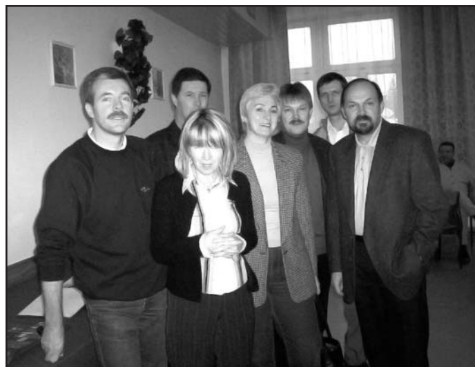
Oto niektórzy z nas po latach

Wieczorem wszyscy spotkali się na kolacji, mając okazję obejrzeć albumy i kroniki pieczołowicie prowadzone i gromadzone przez „naszego trenera i profesora”, nie-