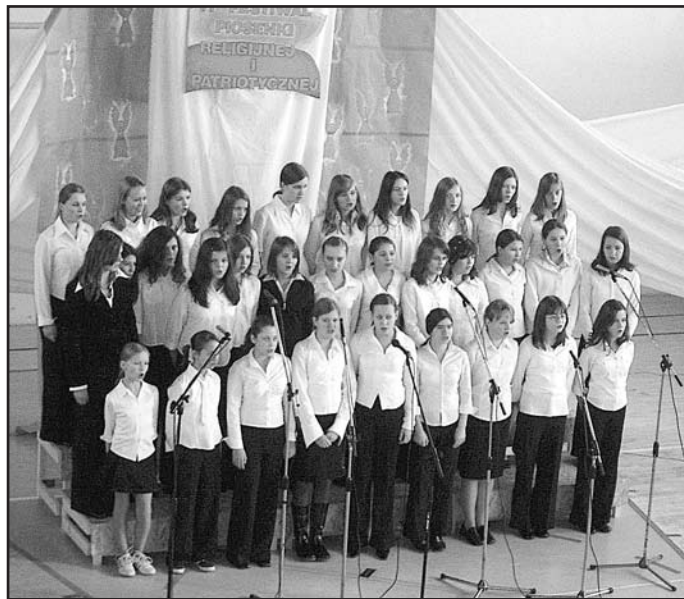
Chór „Tęcza” działający przy MOK w Zambrowie

Złoty Mikrofon otrzymał zespół wokalny ze Szkoły w Zakrzewie Starym.