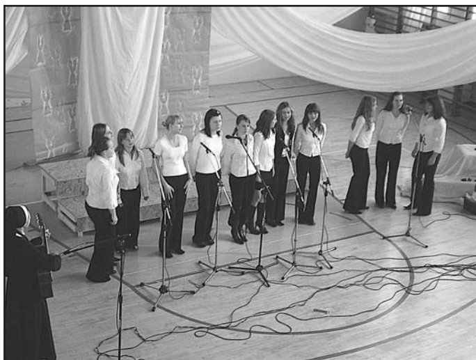
Zespół wokalny „Cantylena” z Zespołu Szkół Ogólnokształcących w Zambrowie

Grand Prix IV Festiwalu Piosenki Religijnej i Patriotycznej jury przyznało zespołowi wokalnemu „Cantylena” z Zespołu Szkół Ogólnokształcących w Zambrowie za wykonanie pieśni „O Boże, o Boże”