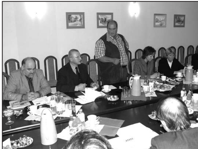
Przewodniczący Europejskiego Komitetu Ekonomiczno-Społecznego dziękuje Staroście Zambrowskiemu oraz Burmistrzowi Miasta za zaproszenie,