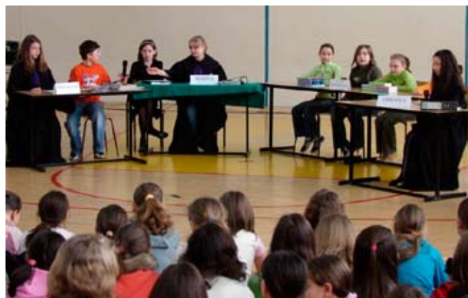
Sąd nad mediami w wykonaniu uczniów klasy V b

Pierwszy Dzień Wiosny w „Piątce” obchodzony jest jako Dzień Kultury Uczniowskiej. W tym roku przebiegał on pod hasłem: „Świat mediów”.