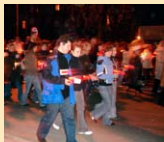
Pochód pamięci ulicami Zambrów w drugą rocznicę śmierci Jana Pawła II, fot. E. Brutkowska