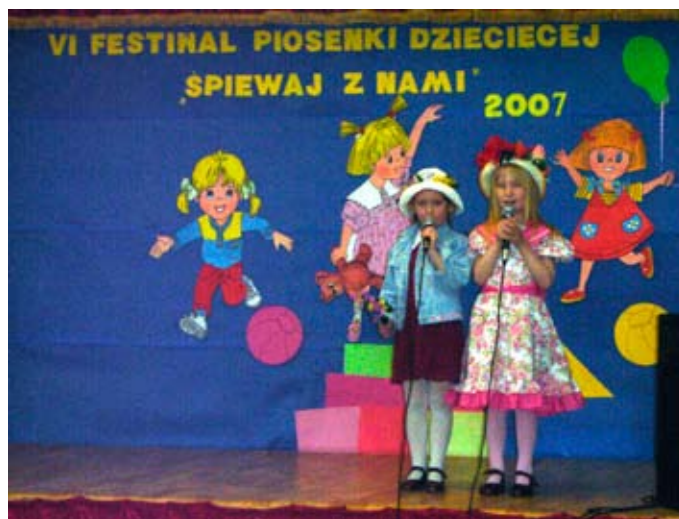
Uczestnicy Festiwalu Piosenki Dziecięcej 2007