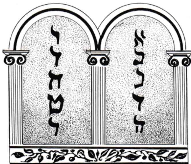
Tablice Mojżesza, rys. Ireneusz Chyliński