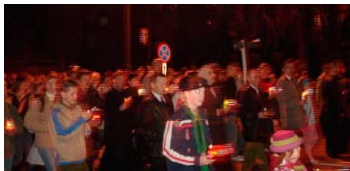
Pochód pamięci ulicami Zambrowa w drugą rocznicę śmierci Jana Pawła II

Mieszkańcy Zambrowa ponownie połączyli się we wspólnej refleksji nad znaczeniem pontyfikatu papieża Jana Pawła II w ich życiu, myślami przeniesli się też do wydarzeń sprzed dwóch lat. W poniedziałek, 2 kwietnia 2007 r., przypadła druga rocznica śmierci papieża Jana Pawła II (1920-2005). Obchodom uroczystości w Zambrowie towarzyszyły msze św. i modlitwy w intencji jego rychłej beatyfikacji i kanonizacji oraz liczne wystąpienia dzieci i młodzieży w zambrowskich parafiach, które przypominały o ogromnym dziedzictwie, jakie Papież Polak po sobie pozostawił.