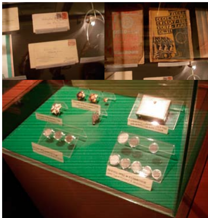
Przedmioty wystawiennicze „Garnizonu Zambrów”

września 1939 r. w Zambrowie. W związku z inauguracją wystawy „Garnizon Zambrów” postanowił przekazać na rzecz RIH cenny dar – naramiennik swego ojca.