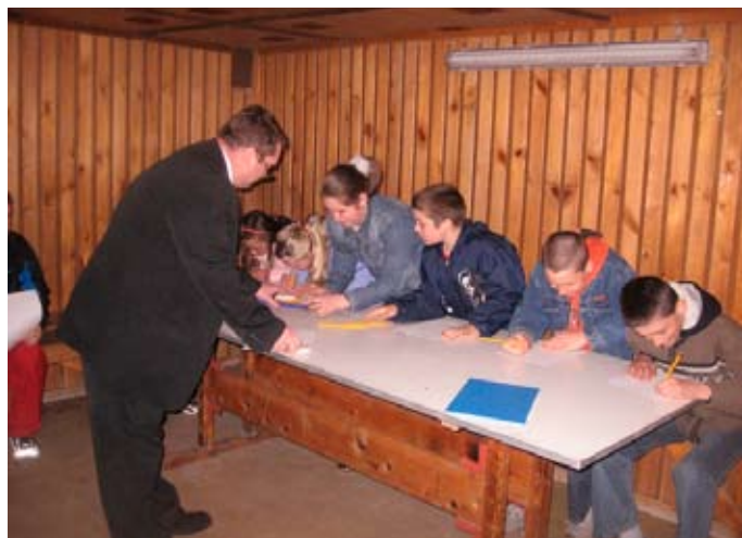
Konkurs „Wiedzy o Podlasiu”, fot. A. Biernaczyk

Degustacja smakołyków ziemi zambrówskiej, spotkania z twórcami ludowymi, konkursy i wiele innych – tak przedstawiał się program na 1 maja br. podczas I spotkania z tradycją. Organizatorem akcji była Rada Sołecka