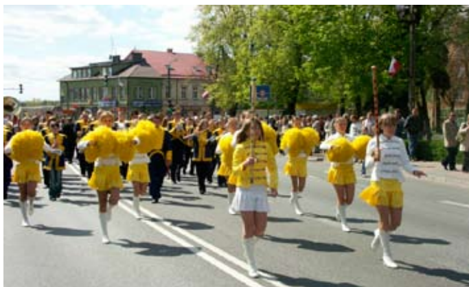
Miejska Młodzieżowa Orkiestra Dęta w Zambrowie, fot. W. Dowlaszewicz