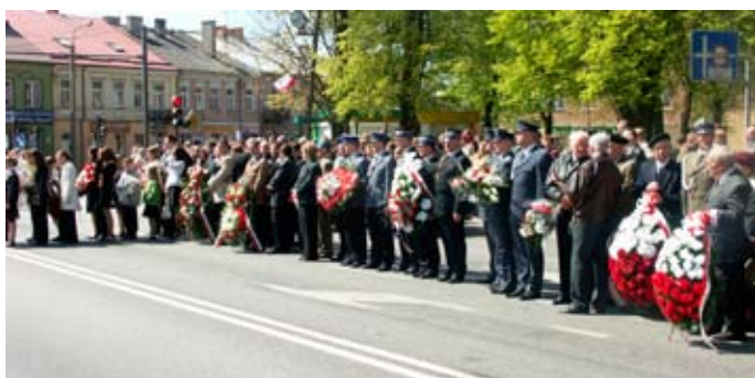
Przedstawiciele władz powiatu, miasta, gminy, delegacje Policji, Straży Pożarnej, zambrowskich szkół, instytucji, związków, partii politycznych, harcerzy oraz mieszkańcy Zambrowa

Konstytucja 3 maja została uchwalona 3 maja 1791 roku, była pierwszą w Europie i drugą na świecie (po konstytucji Amerykańskiej z 1787 r.) spisana konstytucją, która regulowała ustrój prawny Rzeczypospolitej Obojga Narodów.