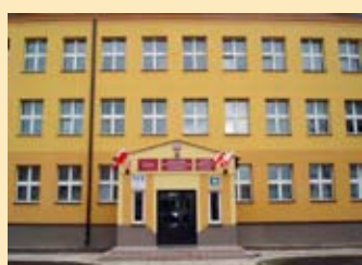
Współczesny budynek LO w Zambrówie