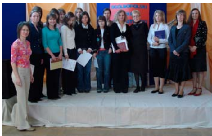
Uczestnicy 52 Ogólnopolskiego Konkursu Recytatorskiego

W piątkowe przedpołudnie - 30.03.2007r w Miejskim Ośrodku Kultury w Zambrowie rozpoczęły się powiatowe eliminacje 52 Ogólnopolskiego Konkursu Recytatorskiego.