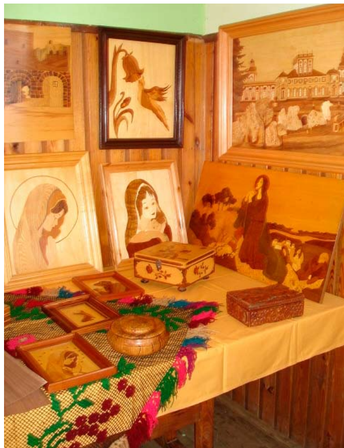
Wystawa rękodzieł

Woli Zambrówskiej, która na cel nadrzędny uznała konieczność promocji kultury ludowej na terenie regionu oraz wsparcie remontu świetlicy na Woli Zambrówskiej. W związku z tym każdy z przybyłych gości mógł złożyć dobrowolną opłatę na ten cel.