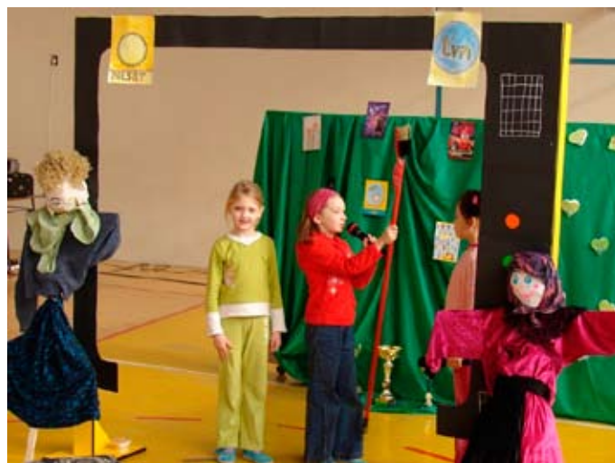
Uczniowie klasy I c prezentują reklamę szczotki Colgate 360

Największy entuzjazm młodzieży wzbudził odlotowy Mini Playback Show przygotowany przez przedstawicieli klas IV i V. Uczniowie wspaniale się bawili.