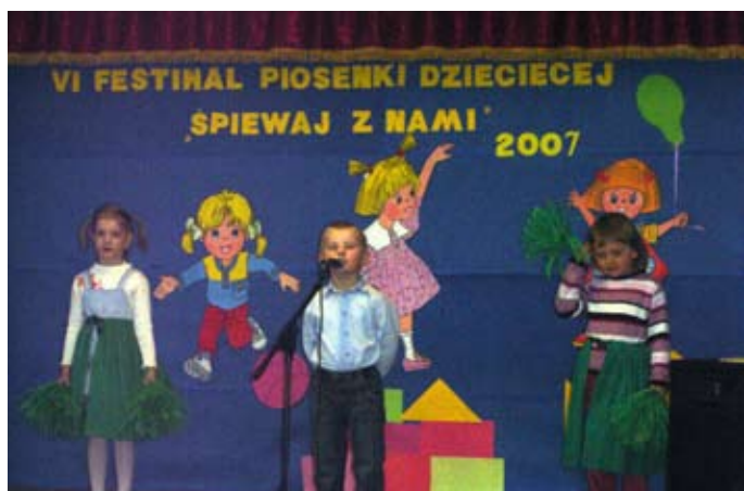
Uczestnicy Festiwalu Piosenki Dziecięcej 2007

Dnia 24 kwietnia br. w Miejskim Przedszkolu nr 6 w Zambrowie odbył się VI Festiwal Piosenki Dziecięcej „Śpiewaj z nami”. Liczne grono małych artystów z zambrowskich przedszkoli – ogółem 42 wykonawców, zaprezentowało swoje zdolności wokalne i taneczne.