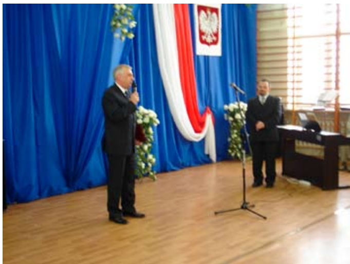
Wystąpienie Burmistrza Miasta Zambrów

Zambrowie”, aż w końcu w 1995 roku szkoła zmieniła patrona i od tej pory nazywa się „I Liceum Ogólnokształcącym im. Stanisława Konarskiego w Zambrowie”. Obecnie wchodzi w skład Zespołu Szkół Ogólnokształcących, obok Gimnazjum Gminnego, do którego uczęszczają uczniowie z Gminy Zambrów.