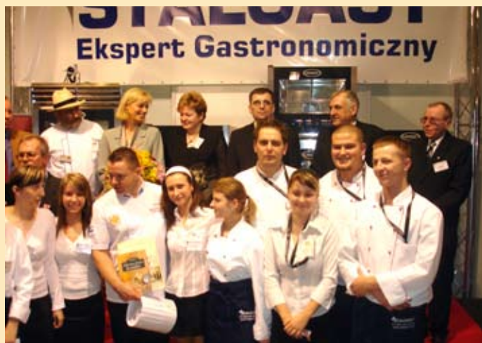
Międzynarodowe Targi EuroGastro, fot. K. Brutkowska