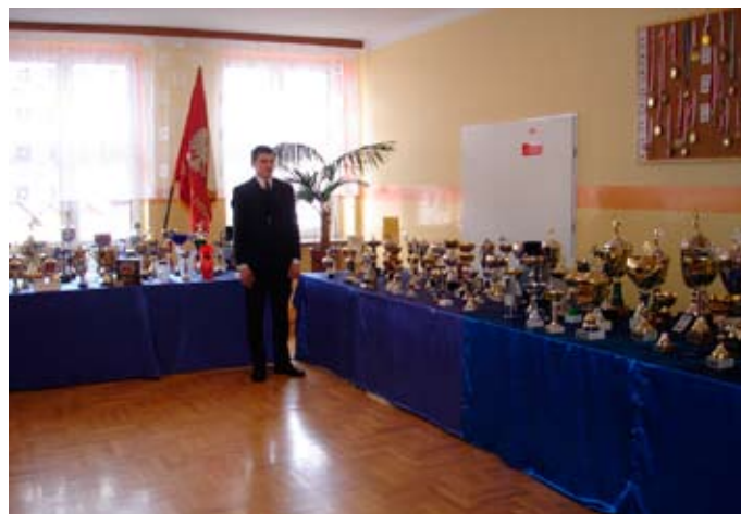
Ekspozycja szkolna

Szkoła została założona w 1946 roku, początkowo pod nazwą „Miejskie Gimnazjum Koedukacyjne Ogólnokształcące w Zambrowie”, w roku 1966 zmieniło nazwę na „Liceum Ogólnokształcące im. Manifestu Lipcowego PKWN w