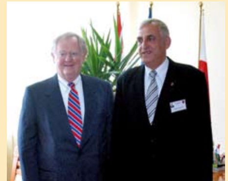
Ambasador USA w Polsce Victor Ashe z wizytą u Burmistrza Miasta Zambrów