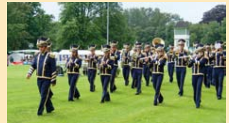
Mistrzostwa Europy Orkiestr Dętych w Rastede (Niemcy), musztra paradna Miejskiej Młodzieżowej Orkiestry Dętej z Zambrowa, fot. PSM Zambrów