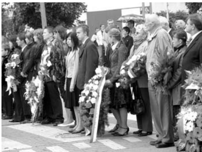
Delegacja przybyła na uroczystość

Zajęcie Zambrowa przez 20 Dywizję Zmotoryzowaną oznaczało praktycznie otoczenie 18 DP. W celu umożliwienia wyjścia Dywizji z okrążenia należało odbić z rąk niemieckich Zambrów i otworzyć drogę w kierunku na Nur nad Bugiem, a więc walka o Zambrów była dla 18 Dywizji szansą wyjścia z okrążenia w kierunku przeprawy przez Bug.