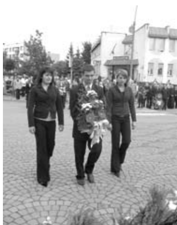
Składanie kwiatów pod pomnikiem

Uroczystość patriotyczna upamiętniająca walki o Zambrów we wrześniu 1939 r. odbyła się pod pomnikiem 71 Pułku Piechoty przy ul. Prym. Stefana Wyszyńskiego. W samo południe rozbrzmiały syreny, wszyscy zebrani w ciszy uczcili pamięć poległych podczas walk o Zambrów. Burmistrz Miasta Zambrów wygłosił okolicznościowe przemówienie, w którym przedstawił ważne fakty historyczne. W kolejnej części programu delegacje zambrowskich szkół,