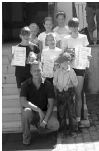
Uczestnicy konkursów organizowanych podczas Dni trzeźwości

W dniu 18.08.2007 r Klub Abstynenta „OSTOJA” w Zambrowie zorganizował obchody Dni trzeźwości dla mieszkańców miasta i gminy Zambrów.