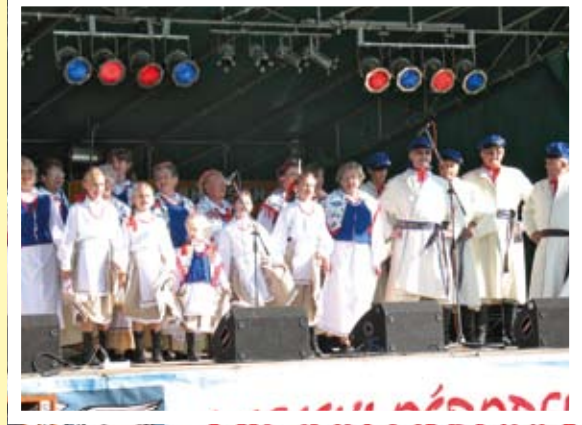
Występ Teatru Form Różnych