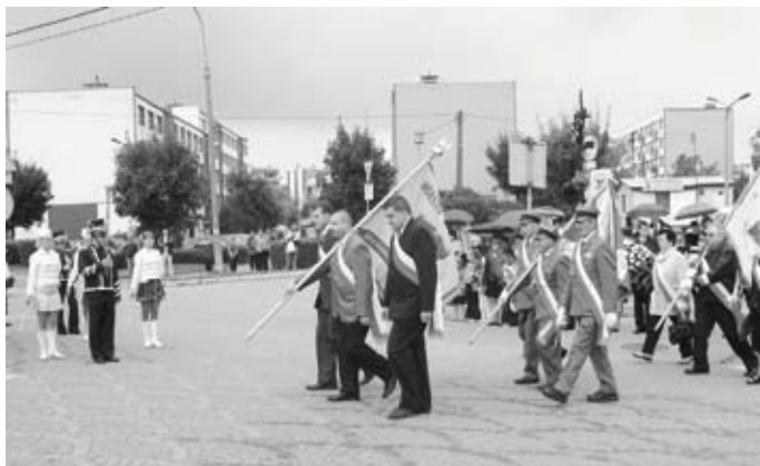
Początki sztandarowe

ptk Stefana Kosseckiego – dowódcy 18 Dywizji, padł rozkaz do natarcia na Zambrów.