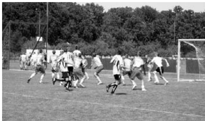
Turniejowy mecz, fot. ZKS OLIMPIA

Drużyna ZKS „OLIMPIA - Zambrów” rocznika 92-93 (z przewagą rocznika 93), 3 osoby z r. 92, 12 osób z r. 93, 2 osoby z r. 94 uczestniczyła w dniach 31.07- 05.08.2007 w V Międzynarodowym Turnieju Piłki Nożnej „REMES CUP 2007” w Opalenicy woj. wielkopolskie. W turnieju uczestniczyło około 4000 zawodników z 249 klubów z kraju i zagranicy. W grupie wiekowej 92 rocznika wystąpiło 35 drużyn, a drużyna ZKS OLIMPIA uzyskała następujące wyniki: Olimpia - Warmia Olsztyn - 1:2