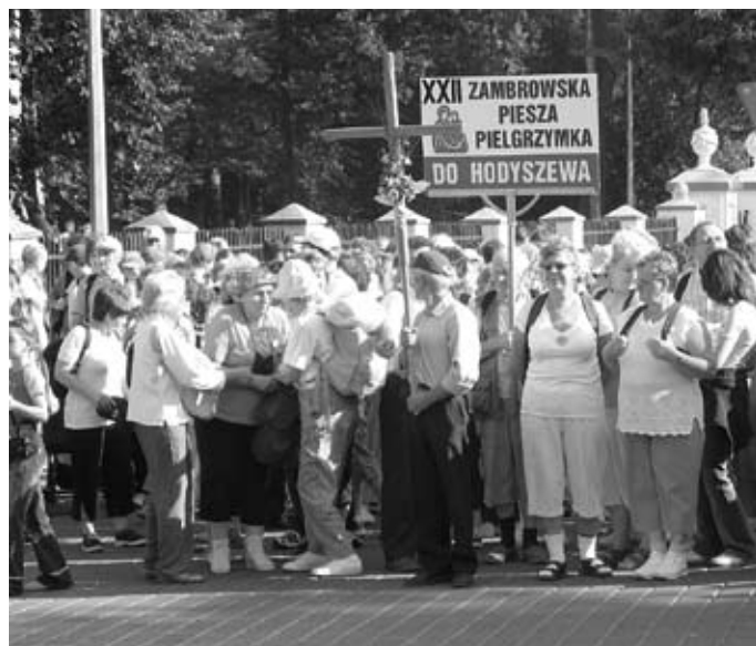
Pielgrzymka wyrusza spod kościoła pw. Trójcy Przenajświętszej

24 sierpnia br. o godzinie 9:00 spod kościoła pw. Trójcy Przenajświętszej w Zambrowie wyruszyła XXII Zambrowska Piesza Pielgrzymka do Hodyszewa .