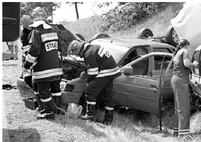
Symulacja wypadku samochodowego

brg. Sławomir Skrzypkowski Powiatowa Państwowa Straż Pożarna w Zambrowie