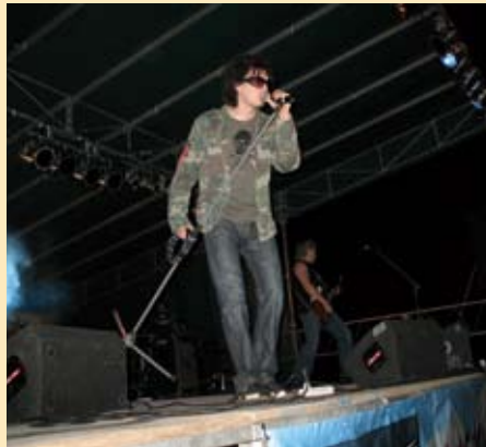
Koncert zespołu Bracia, Pożegnanie Lata 2007