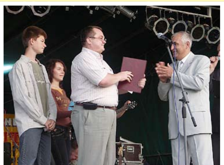
Rozwiązanie konkursu na Slogan reklamowy Zambrowa