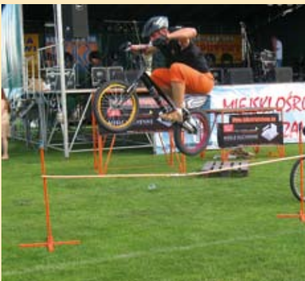
BikeTrialShow, Pożegnanie Lata 2007