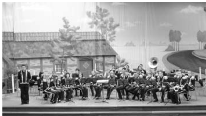
Musztra paradna

– „Nikt nie liczył na medal, chcieliśmy wziąć udział w prestiżowym konkursie, gdzie występują bardzo dobre orkiestry zachodniej Europy. Samo zakwalifikowanie do konkursu było sukcesem, natomiast zdobycie medalu przeszło nasze najśmielsze oczekiwania! Tym większa jest nasza radość.” – komentują członkowie Miejskiej Młodzieżowej Orkiestry Dętej w Zambrowie.