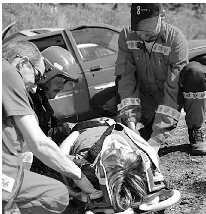
Symulacja wypadku samochodowego

Symulacja wypadku samochodowego, nauka udzielania pierwszej pomocy i prezentacja najnowocześniejszych środków bezpieczeństwa drogowego. W miejscowości Rutki odbył się happening, organizowany w ramach społecznego programu „Drogi Zaufania. Bezpieczna Ósemka”, realizowanego przez Generalną Dyрекcję Dróg Krajowych i Autostrad.