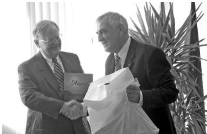
Wizyta Ambasadora Victora Ashe w Zambrowie

W czwartek 30 sierpnia br. z wizytą do Zambrowa przybył Ambasador USA Victor Ashe, był to ostatni dzień wizyty Ambasadora w Północno - Wschodniej Polsce.