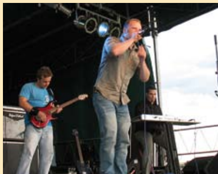
Koncert zespołu QRS, Pożegnanie Lata 2007