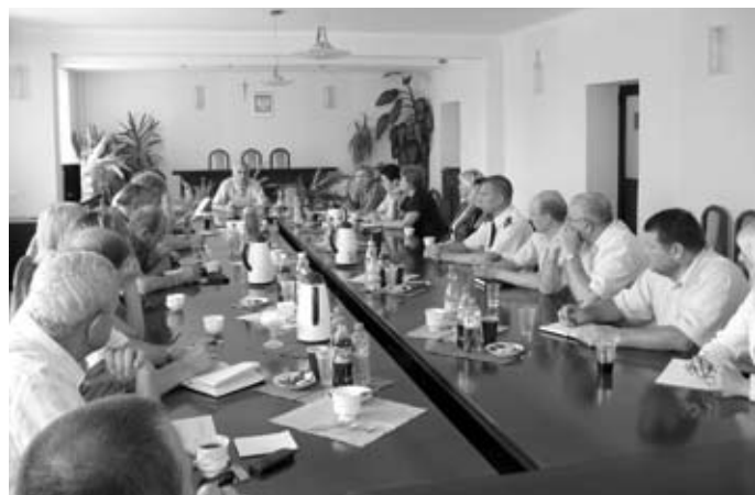
Spotkanie Burmistrza Miasta Zambrow z dyrektorami szkół i placówek oświatowych, przedstawicielami Policji oraz firm ochroniarskich

Wszyscy wiemy, że należy natychmiast położyć kres takiemu