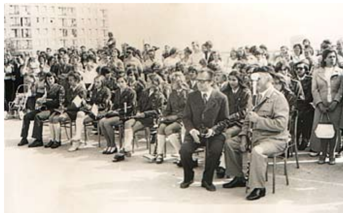
Otwarcie nowego budynku Szkoły Podstawowej Nr 3 i nadanie szkole imienia Janusza Kusocińskiego, 2 września 1974 r. Otwarcie Szkoły Podstawowej Nr 3, Występ Orkiestry Dętej Liceum Ogólnokształcącego