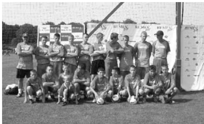
Drużyna Zambrowskiej OLIMPII