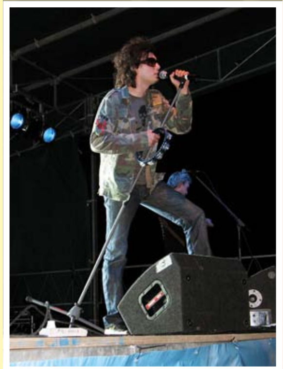
Koncert zespołu BRACIA