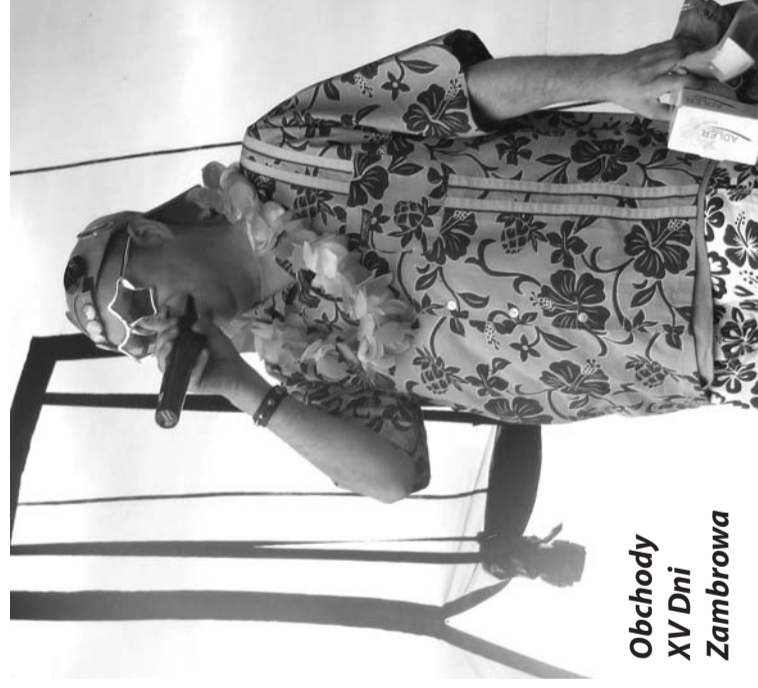
Obchody XV Dni Zambrowa