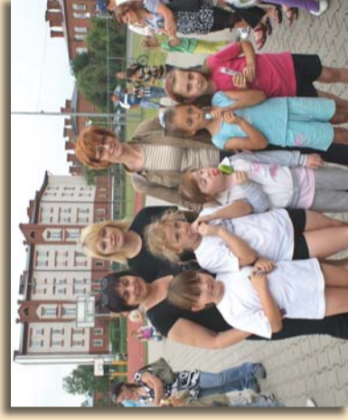
Olimpiada Integracyjna w Zambrowie fot. 1. Wolontariusze