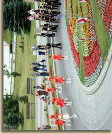
VII Międzynarodowa Zambrowska Parada Orkiestr Dętych, fot. 2. T. Krassowski