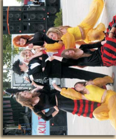
Obchody XV Dni Zambrowa