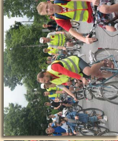
Akcja „Zambrow na rowery”