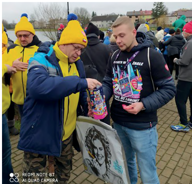
REDMI NOTE 8T AI QUAD CAMERA