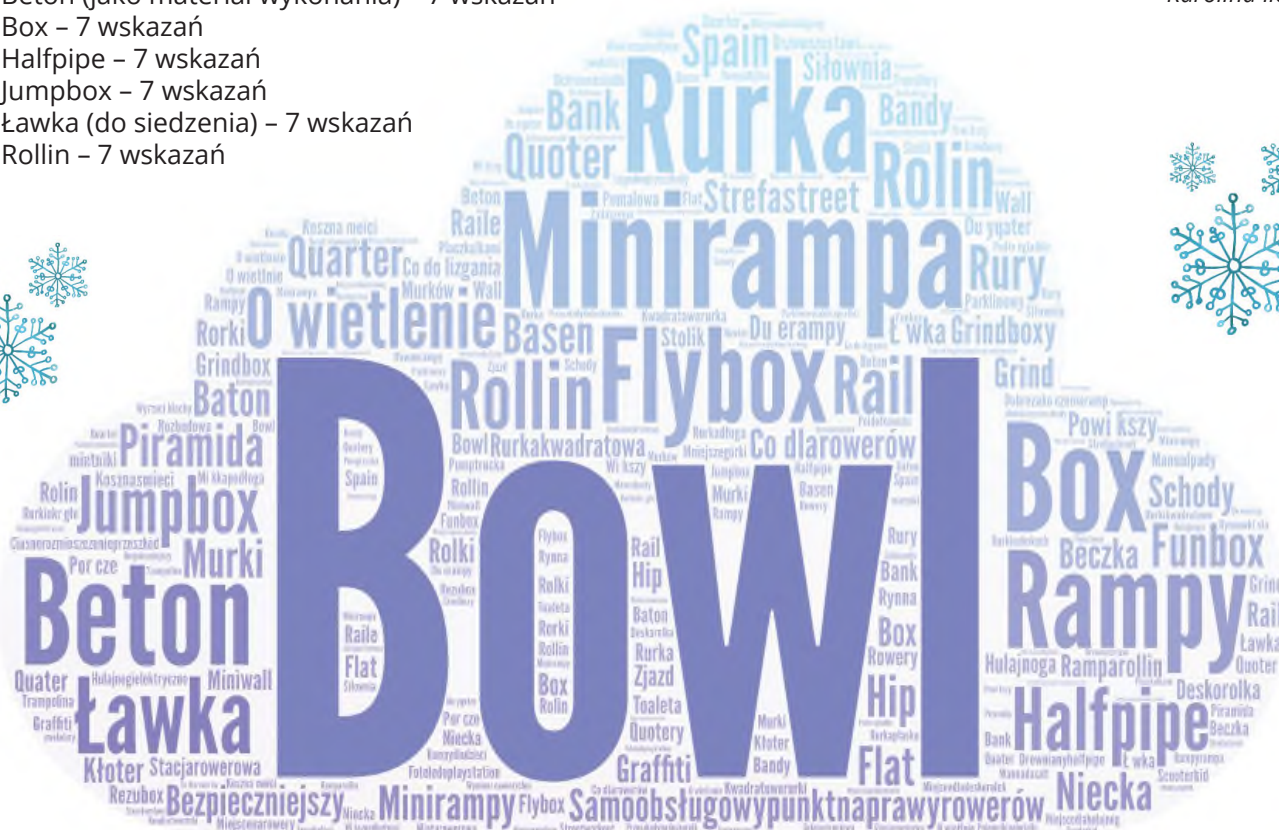
Grafika 1 Analiza frekwencyjności słów.