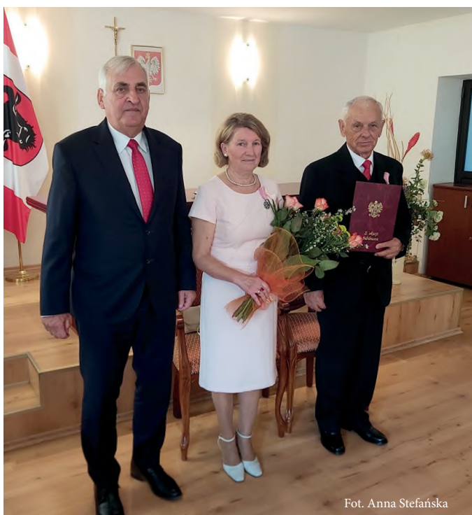
Fot. Anna Stefańska

Anna Stefańska Kierownik Urzędu Stanu Cywilnego w Zambrowie