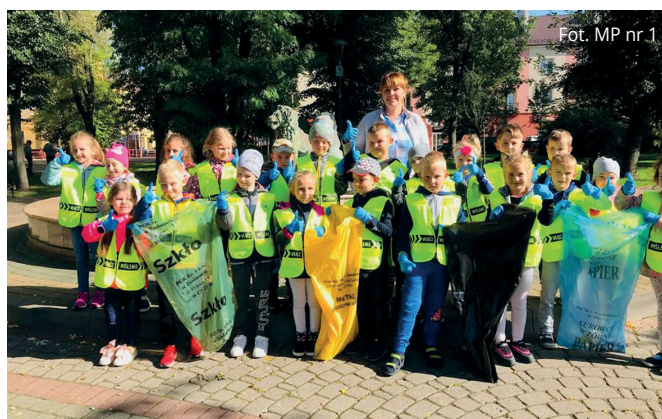
Fot. MP nr 1