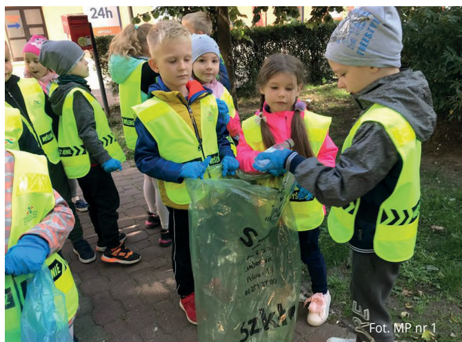
Fot. MP nr 1