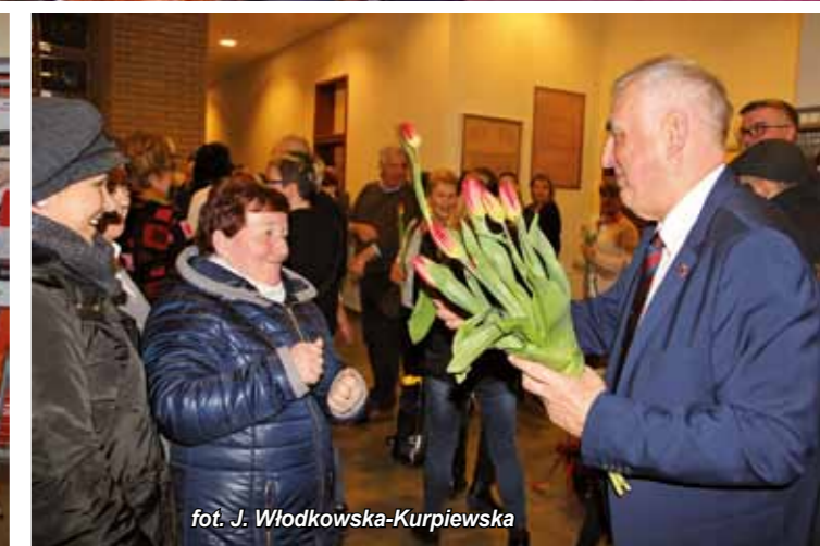
fot. J. Włodkowska-Kurpiewska