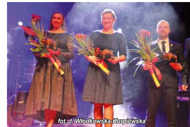
fol. J. Włodkowska-Kurpiewska