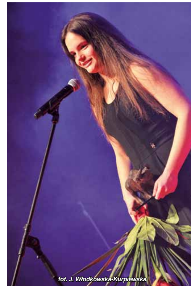
fol. J. Włodkowska-Kurpiewska