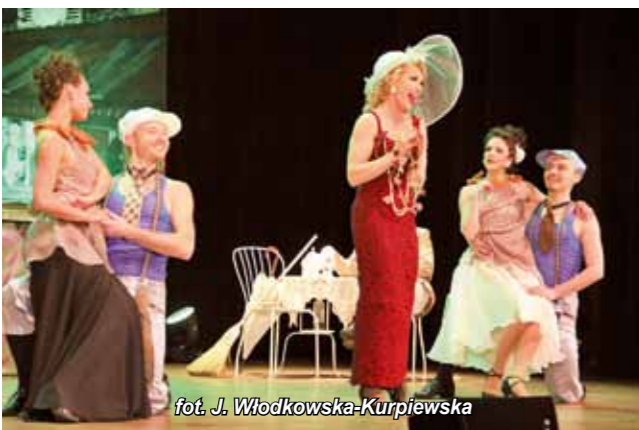
fol. J. Włodkowska-Kurpiewska

Babciom i Dziadkom serdeczne życzenia, następnie na scenie wystąpił Teatr Muzyczny Iwa.