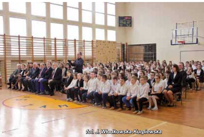
fol. J. Włodkowska-Kurpiewska