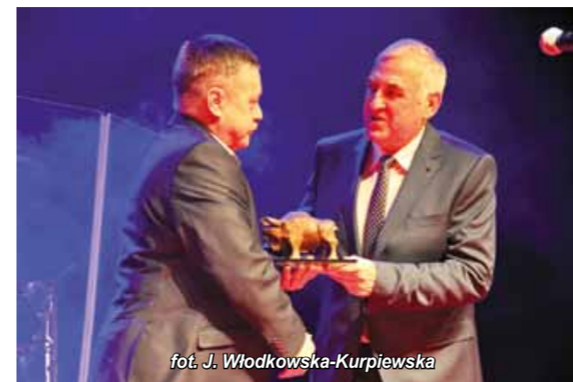
fol. J. Włodkowska-Kurpiewska