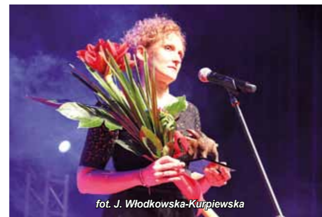
fol. J. Włodkowska-Kurpiewska