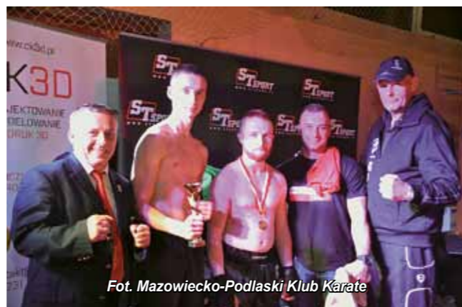
Fot. Mazowiecko-Podlaski Klub Karate