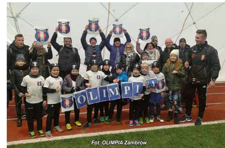
Fot. OLIMPIA Zambrów