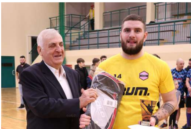
Fot. J. Włodkowska - Kurpiewska