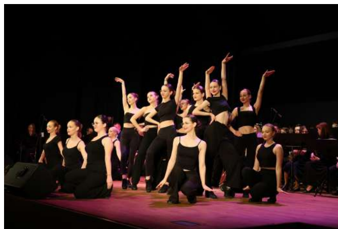
Fot. J. Włodkowska – Kurpiewska

Justyna Włodkowska – Kurpiewska Biuro Promocji Miasta Zambrów