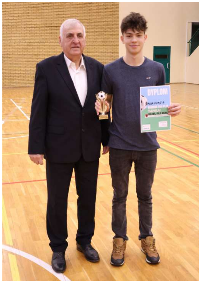
Fot. J. Włodkowska - Kurpiewska