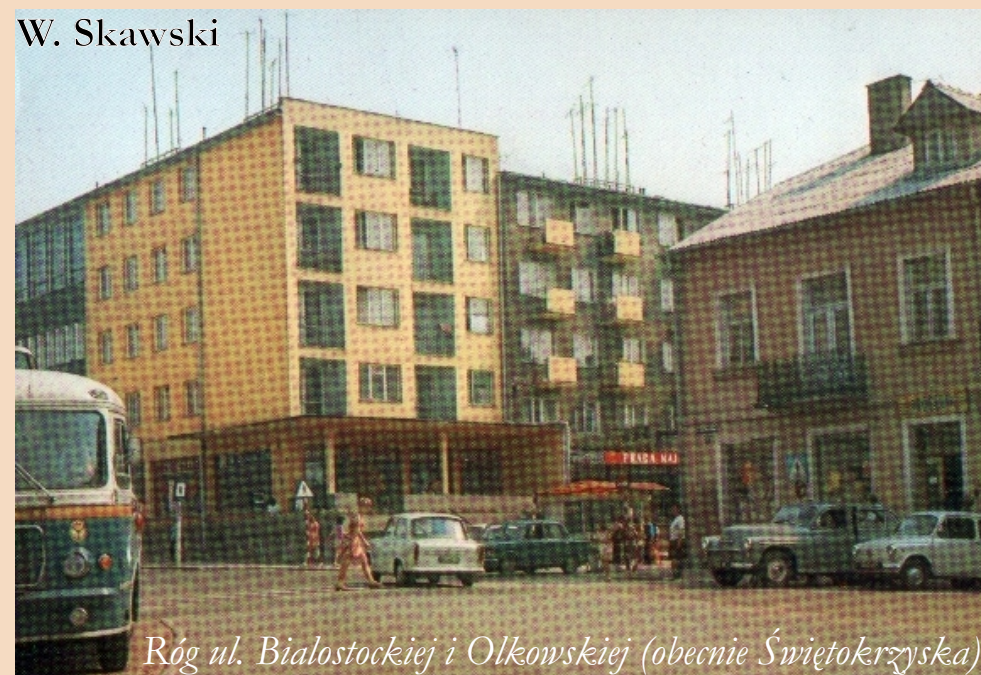
Róg ul. Białostockiej i Olkowskiej (obecnie Świętokrzyska)