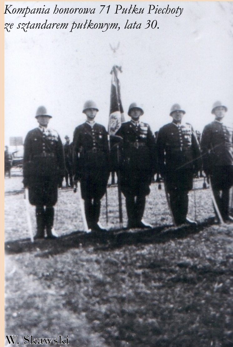
Kompania honorowa 71 Pułku Piechoty ze sztandarem pułkowym, lata 30.