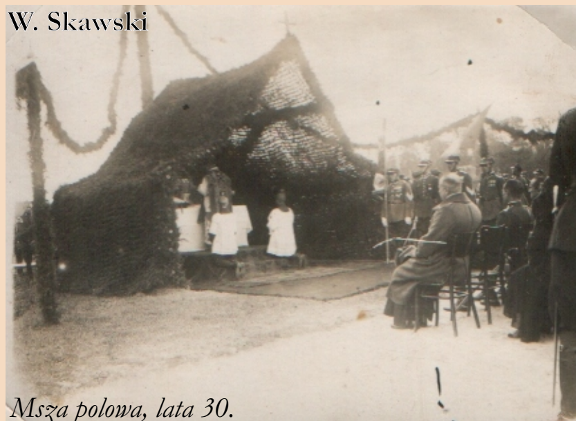
Msza polowa, lata 30.