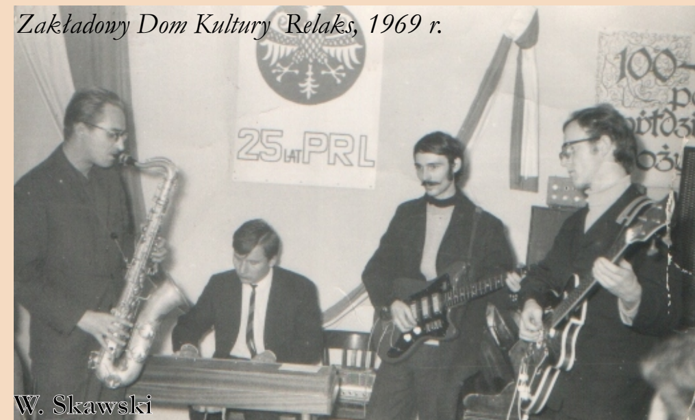
Zakładowy Dom Kultury Relaks, 1969 r.