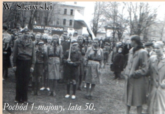
Pochód 1-majowy, lata 50.