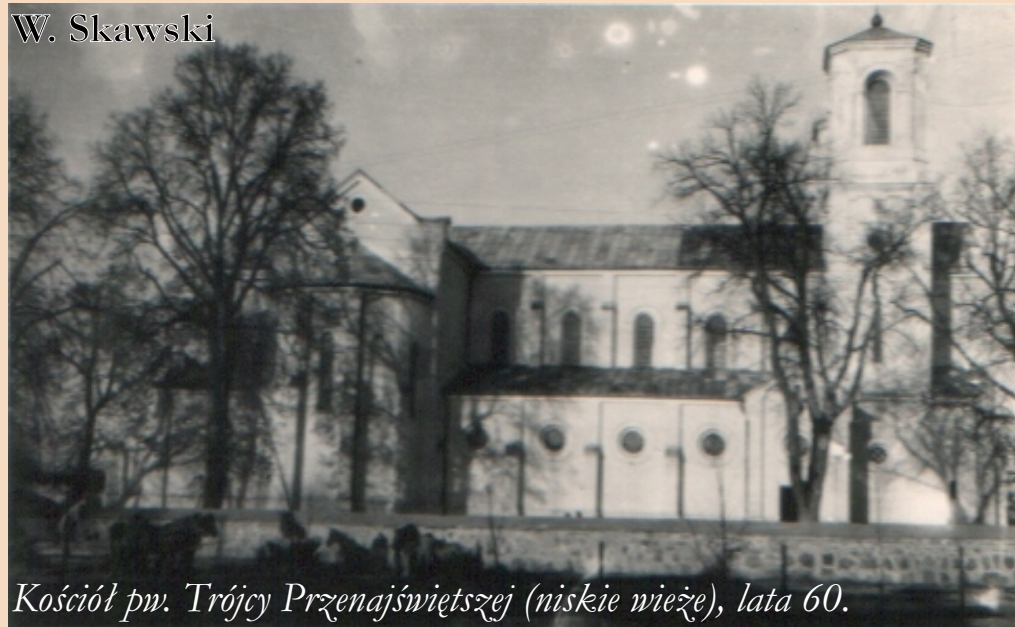
Kościół pw. Trójcy Przenajświętszej (niskie wieże), lata 60.