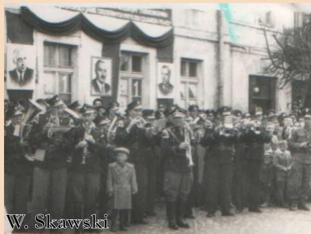
Rynek zambrowski, obchody 1-majowe, lata 50.