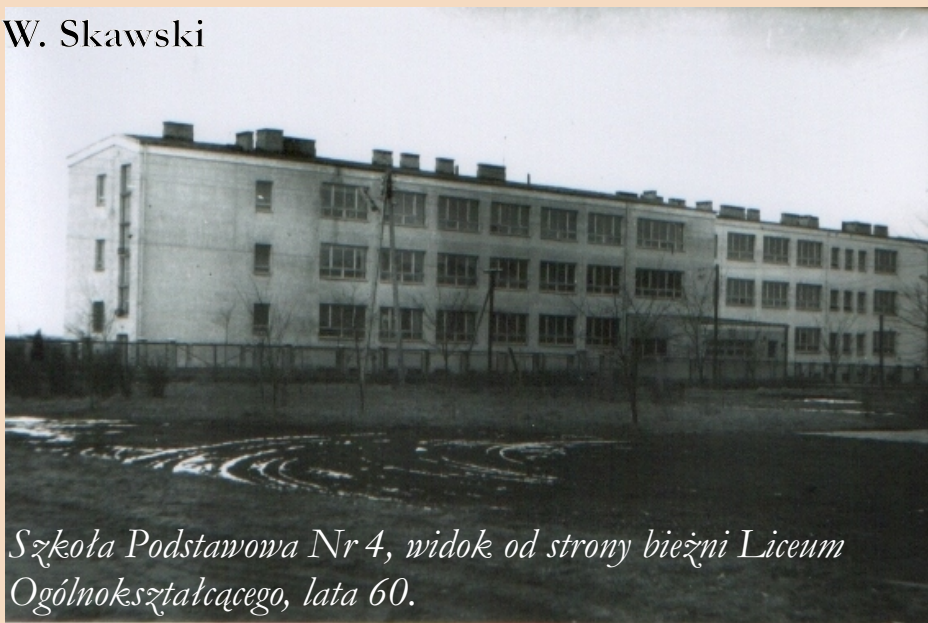
Szkoła Podstawowa Nr 4, widok od strony bieżni Liceum Ogólnokształcącego, lata 60.