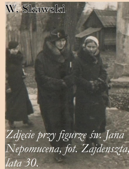
Zdjęcie przy figurze św. Jana Nepomucena, fot. Zajdenszta, lata 30.