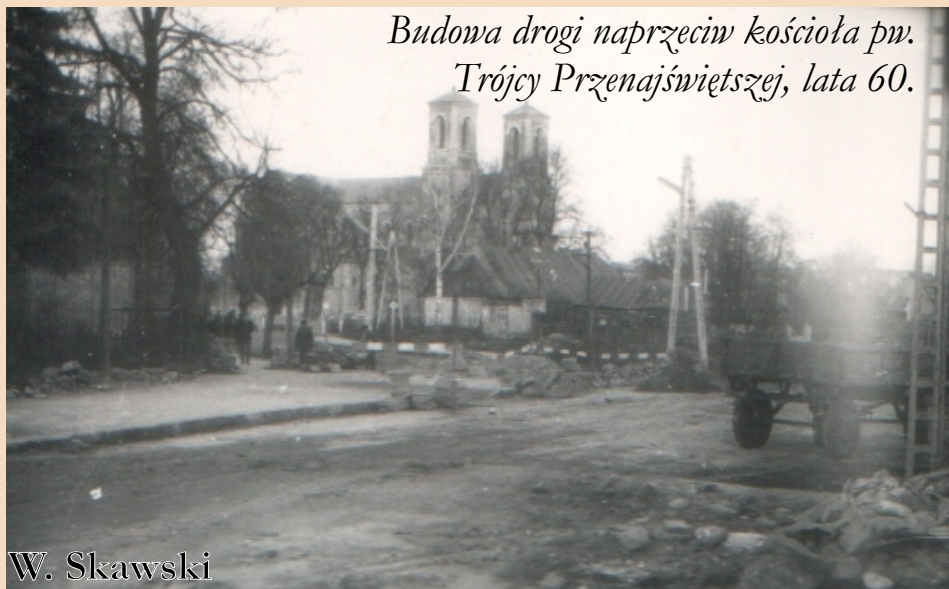
Budowa drogi naprzeciw kościoła pw. Trójcy Przenajświętszej, lata 60.