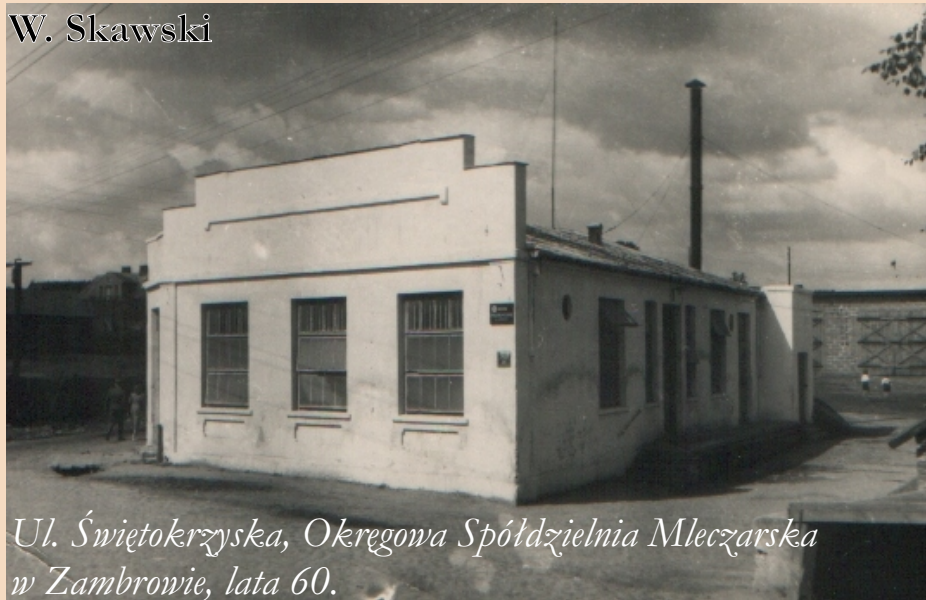
Ul. Świętokrzyska, Okręgowa Spółdzielnia Mleczarska w Zambrówie, lata 60.