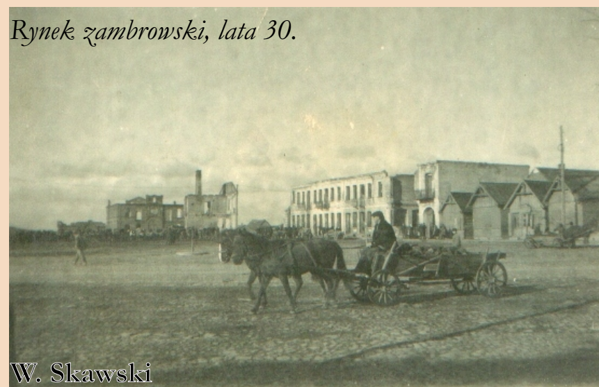
Rynek zambrowski, lata 30.