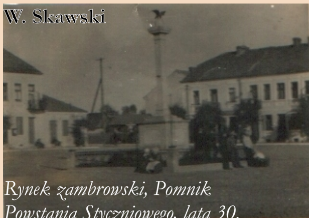
Rynek zambrowski, Pomnik Powstania Styczniowego, lata 30.