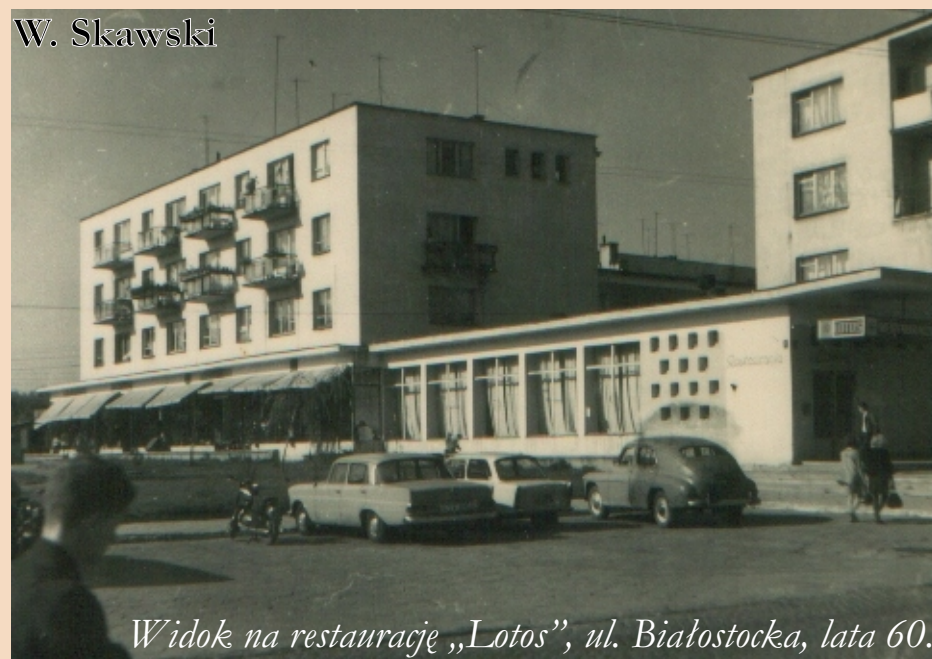
Widok na restaurację „Lotos”, ul. Białostocka, lata 60.