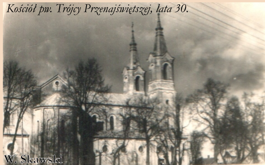
Kościół pw. Trójcy Przenajświętszej, lata 30.