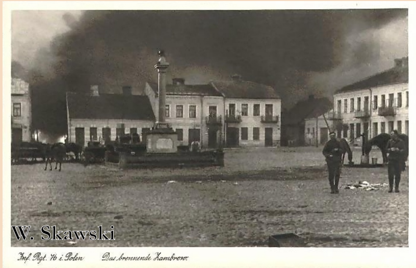
Zambrowski rynek po 10-12 września 1939 r.