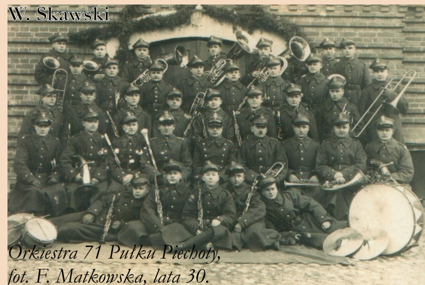
Orkiestra 71 Pułku Piechoty, lata 30.