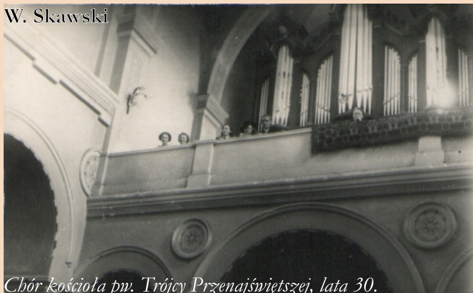
Chór kościoła pw. Trójcy Przenajświętszej, lata 30.