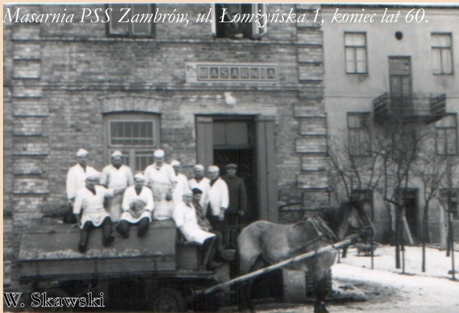
Masarnia PSS Zambrów, ul. Łomżyńska 1, koniec lat 60.