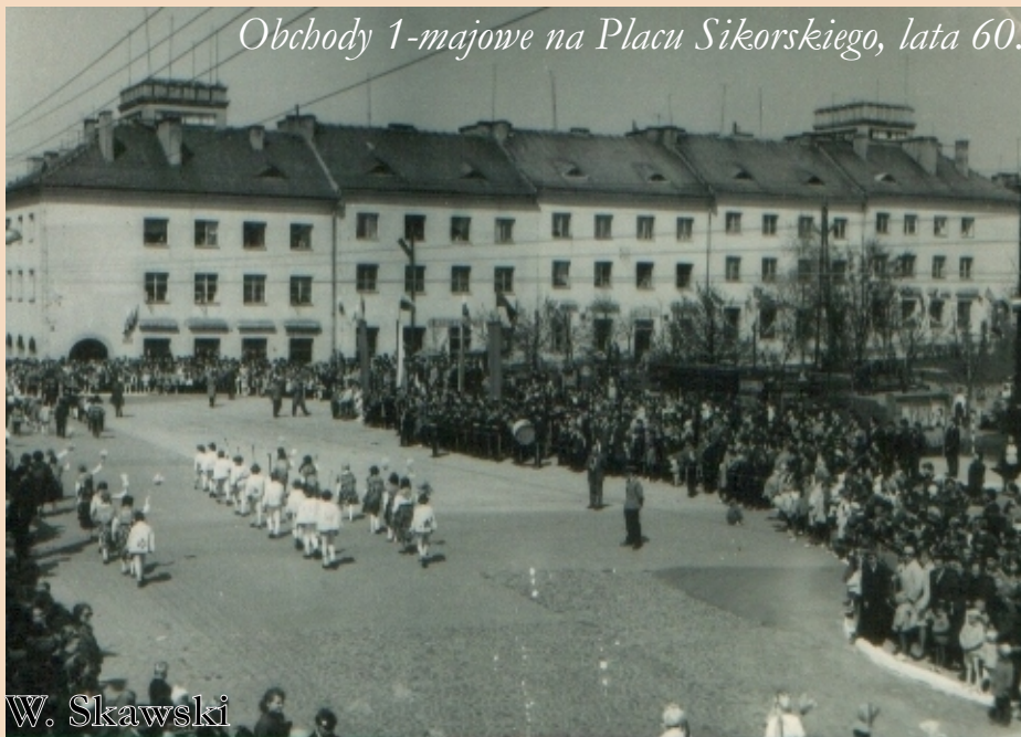
Obchody 1-majowe na Placu Sikorskiego, lata 60.