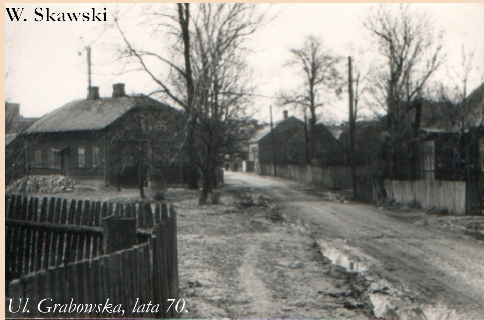
Ul. Grabowska, lata 70.