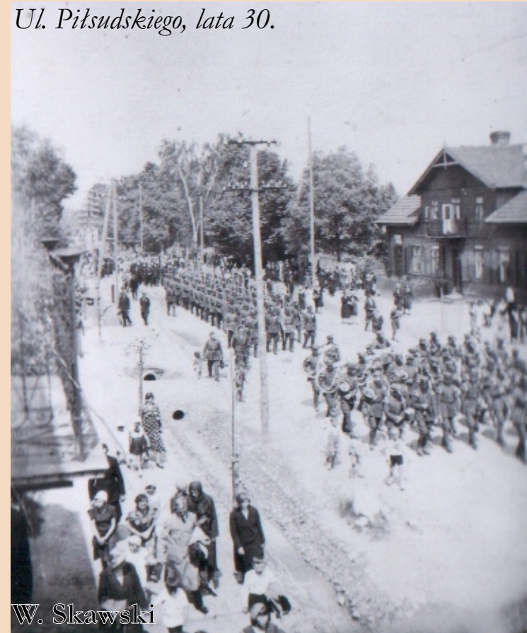
Ul. Piłsudskiego, lata 30.