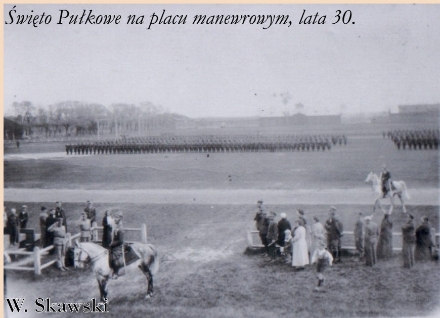
Święto Pułkowe na placu manewrowym, lata 30.