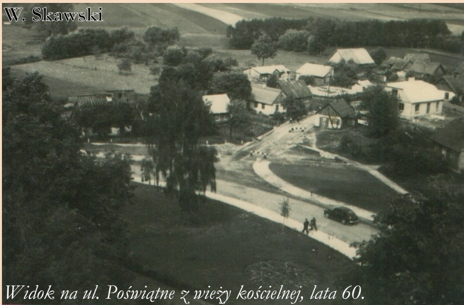
Widok na ul. Poświętne z wieży kościelnej, lata 60.