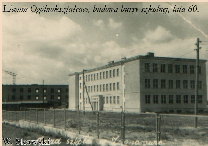
Liceum Ogólnokształcące, budowa bursy szkolnej, lata 60.