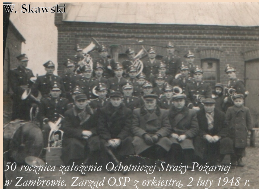
50 rocznica założenia Ochotniczej Straży Pożarnej w Zambrowie. Zarząd OSP z orkiestrą, 2 luty 1948 r.