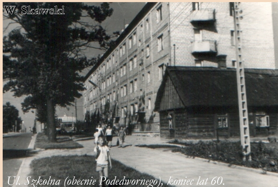
Ul. Szkolna (obecnie Podedwornego), koniec lat 60.