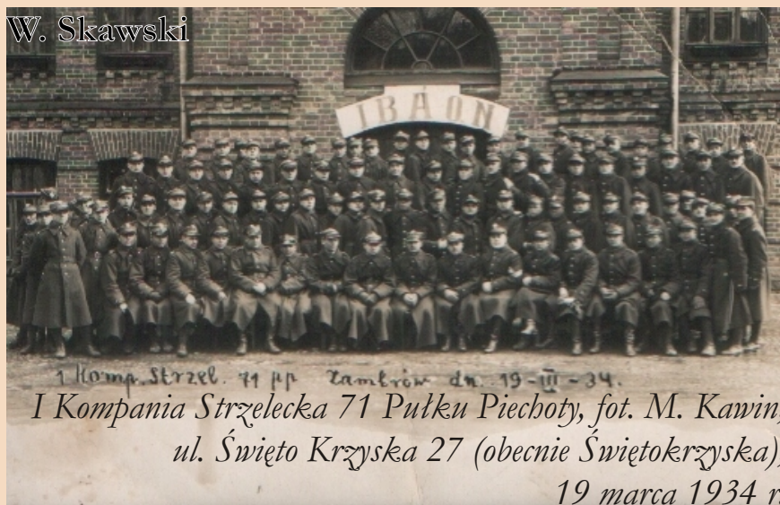
1 Komp. Strzel. 71 pp Zambrów dn. 19-III-34. I Kompania Strzelecka 71 Pułku Piechoty, fot. M. Kawin, ul. Święto Krzyska 27 (obecnie Świętokrzyska), 19 marca 1934 r.