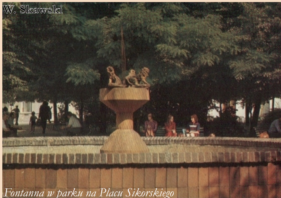
Fontanna w parku na Placu Sikorskiego