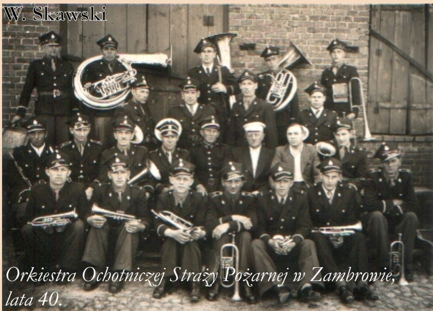
Orkiestra Ochotniczej Straży Pożarnej w Zambrowie, lata 40.