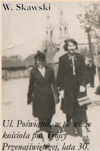
Ul. Poświętne, w tle wieże kościółki pw. Trójcy Przenajświętszej, lata 30.