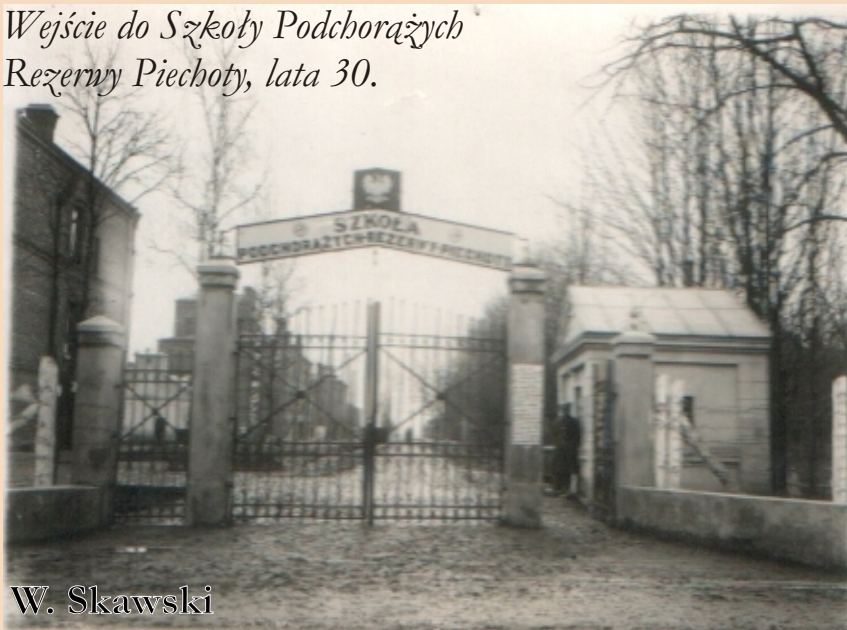
Wejście do Szkoły Podchorążych Rezerwy Piechoty, lata 30.