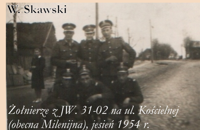
Żołnierze z JW. 31-02 na ul. Kościelnej (obecna Milenijna), jesień 1954 r.