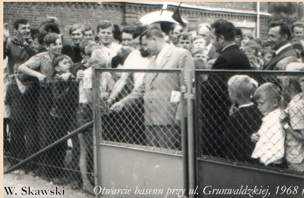
W. Skawski Otwarcie basenu przy ul. Grunwaldzkiej, 1968 r.