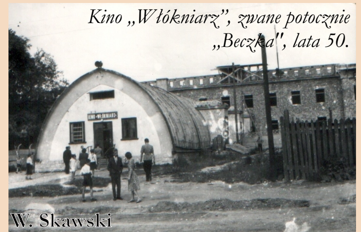
Kino „Włókniarz”, zwane potocznie „Beczka”, lata 50.