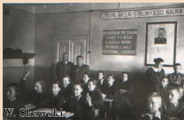
Szkoła Powszechna Nr 1 - wewnątrz, 1953 r. po śmierci Józefa Stalina