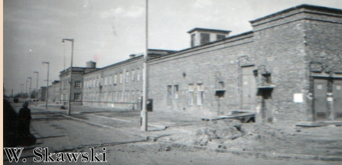
Budynek przedzalni Zambrowskich Zakładów Przemysłu Bawełnianego, lata 50.