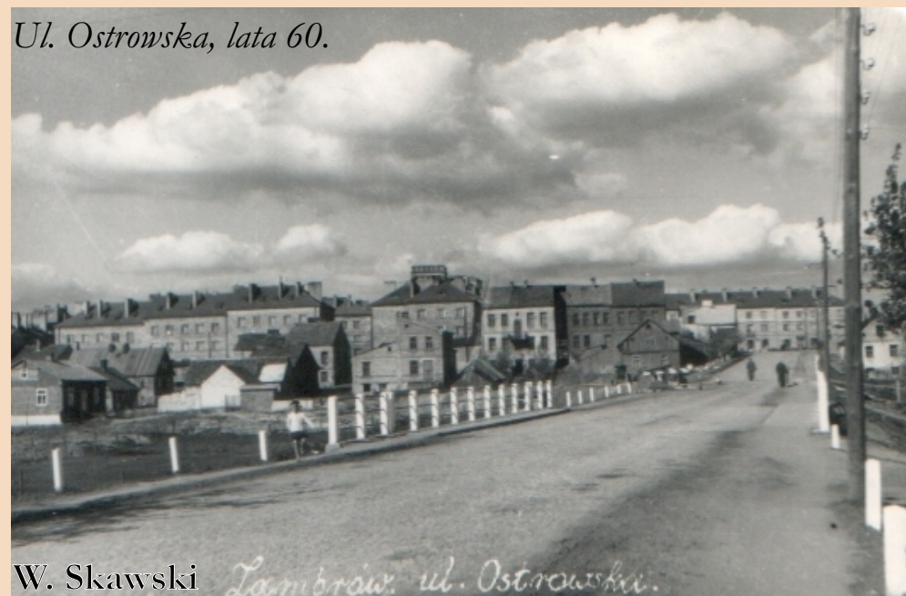
Ul. Ostrowska, lata 60.