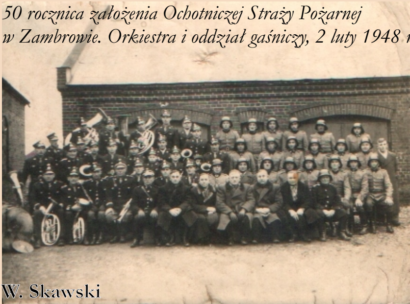
50 rocznica założenia Ochotniczej Straży Pożarnej w Zambrowie. Orkiestra i oddział gaśniczy, 2 luty 1948 r.