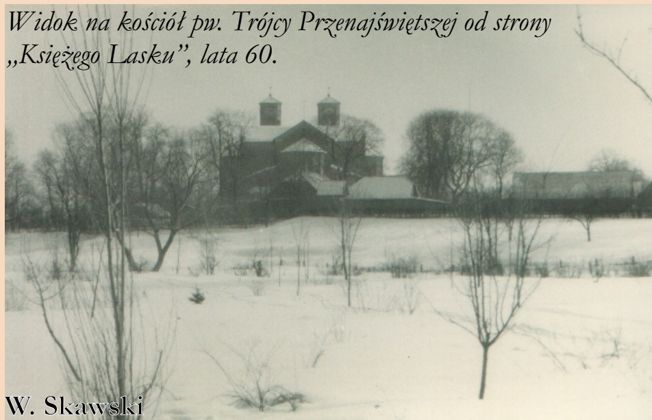
Widok na kościół pw. Trójcy Przenajświętszej od strony „Księżego Lasku”, lata 60.