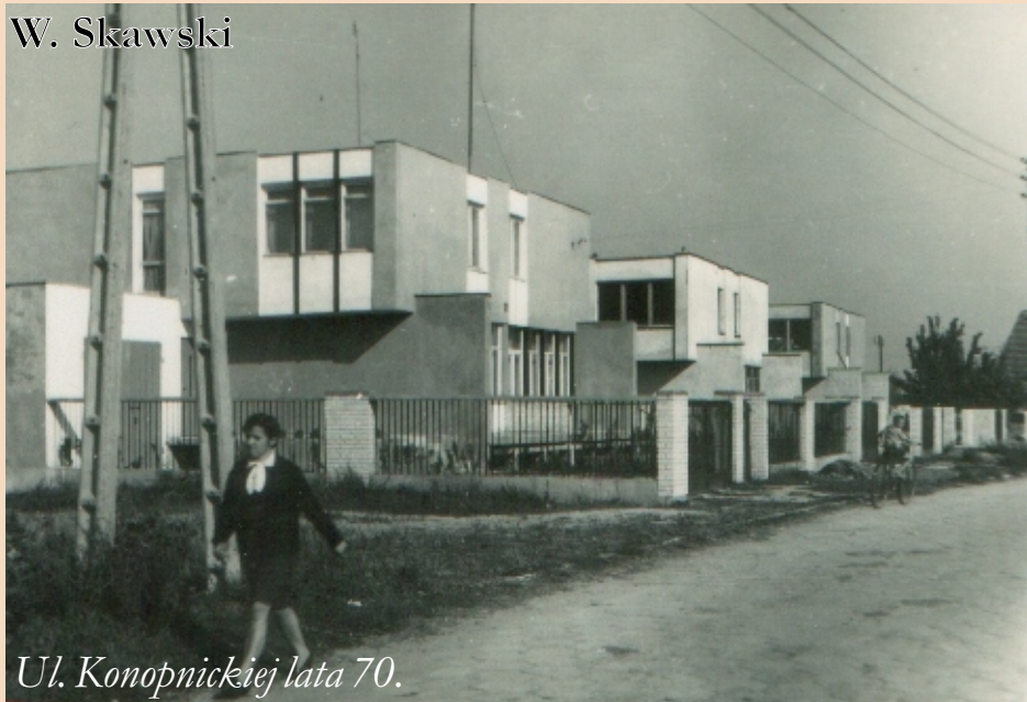
Ul. Konopnickiej lata 70.