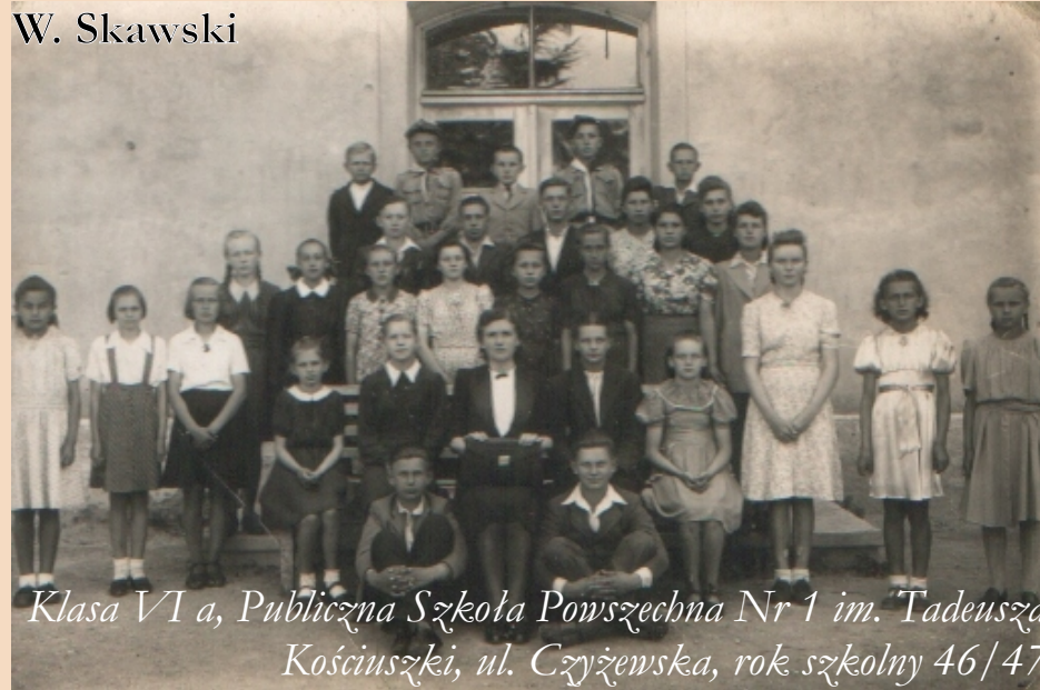
Klasa VI a, Publiczna Szkoła Powszechna Nr 1 im. Tadeusza Kościuszki, ul. Czyżewska, rok szkolny 46/47