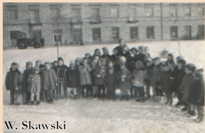
Grupa dzieci w wieku przedszkolnym wraz z wychowawczynią na zambrowskim rynku, początek lat 50.