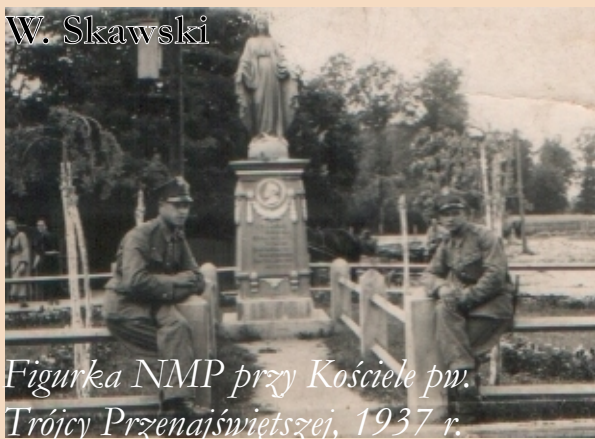
Figurka NMP przy Kościele pw. Trójcy Przenajświętszej, 1937 r.