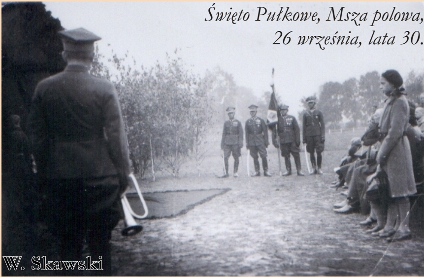
Święto Pułkowe, Msza polowa, 26 września, lata 30.