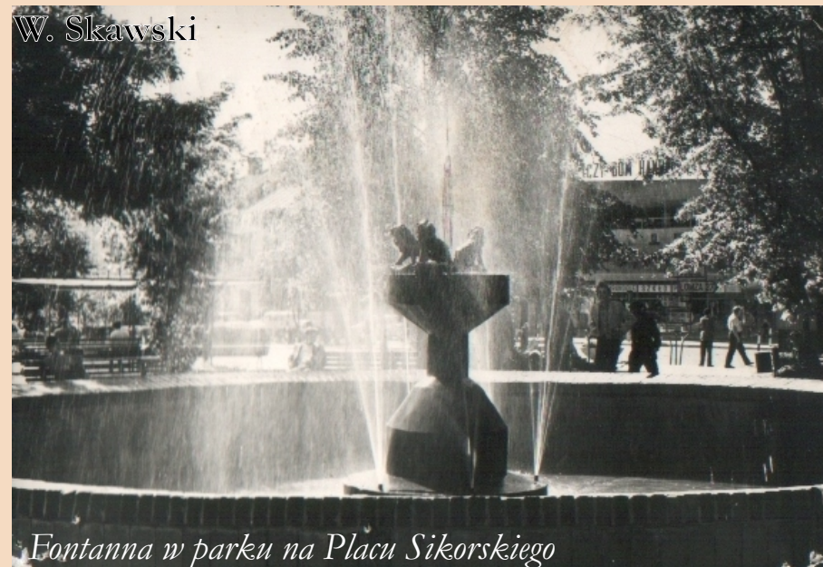
Fontanna w parku na Placu Sikorskiego