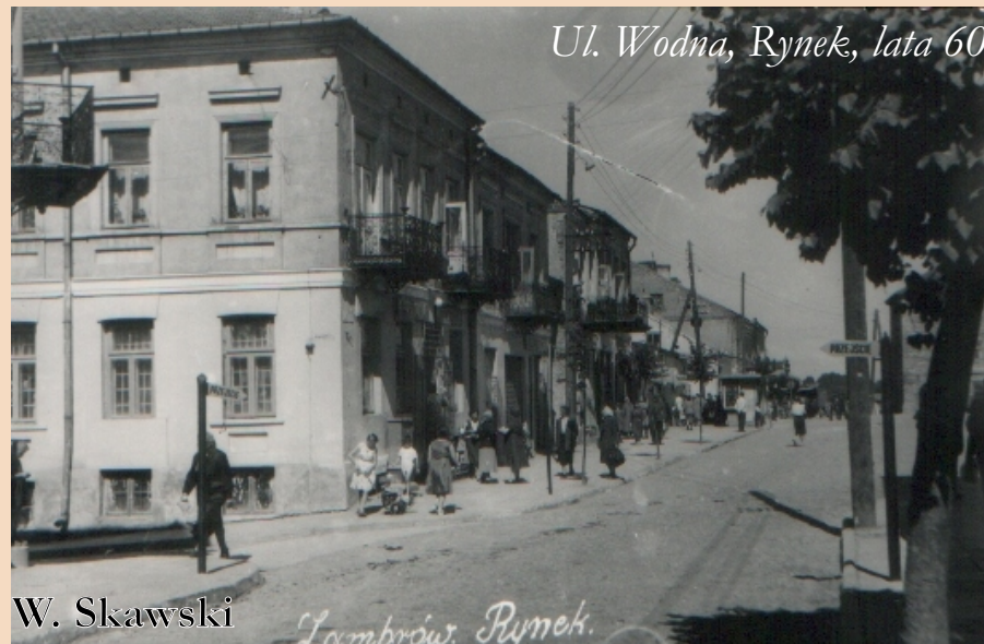
Ul. Wodna, Rynek, lata 60.